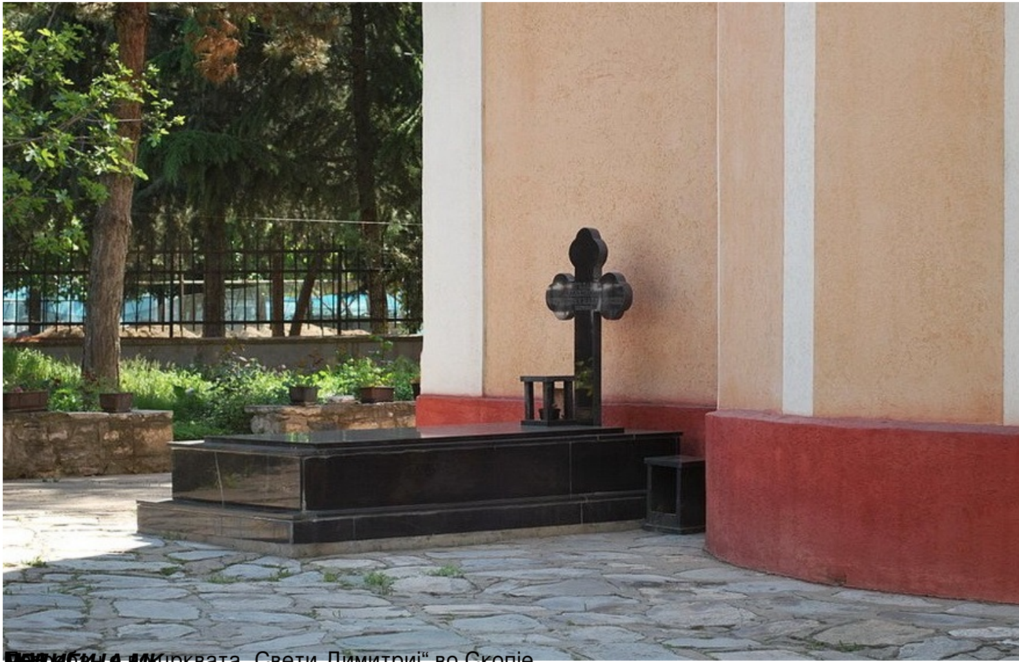
ПЕТРИЈА ИК црквата „Свети Димитриј“ во Скопје.