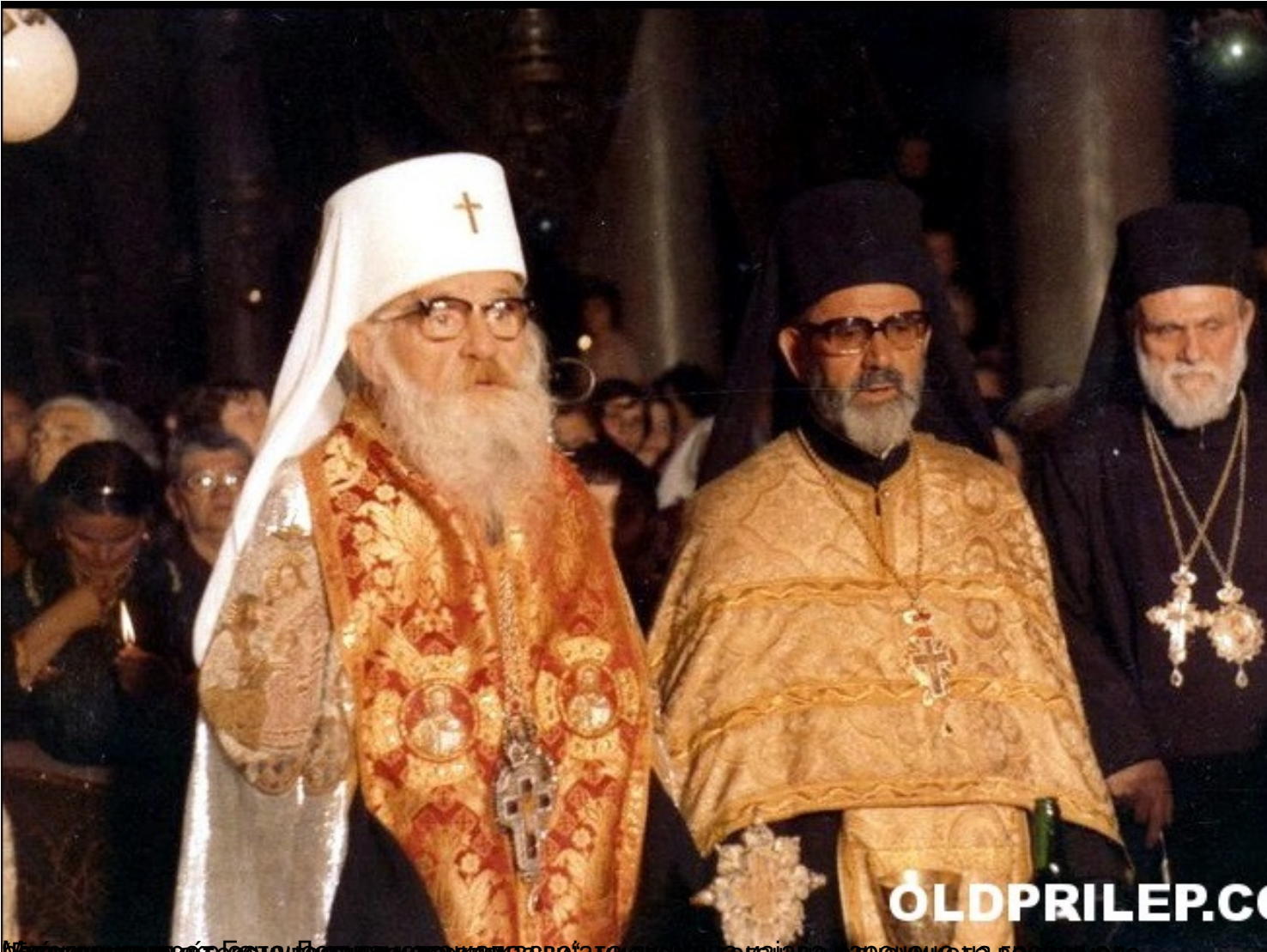
Манастир Светог Василија Крстичког у својој матици на изјаву одлучивања востанувања