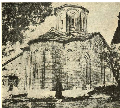
Св. Спасъ — с. Чучерь.

една плоча во ѕидовите на манастирот, но била уништена од шовинистот Милоевич кој преблечен во мајсторски алишта ги обиколувал тие места (Материјали 536). Североисточно од село Чучер (Скопска Црна Гора), на 1 и ½ час растојание во планината било старото село св. Спас, по кое името го носи манастирот, при истото село.. Тој манастир остана србомански.