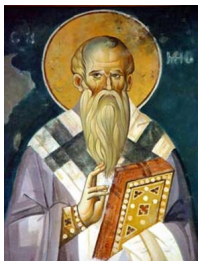
Свети Климент Охридски

На Третиот црковно-народен собор, одржан на 18 јули 1967 година, била прогласена автокефалноста на Македонската православна црква, настан, кој, секако, треба да се прифати како момент за возобновување на Македонската православна црква, два века по нејзиното незаконско укинување. Токму од таа причина годинава, кога се навршија 50-години од возобновувањето на Охридската архиепископија во името на Македонската православна црква се одржаа големи прослави.