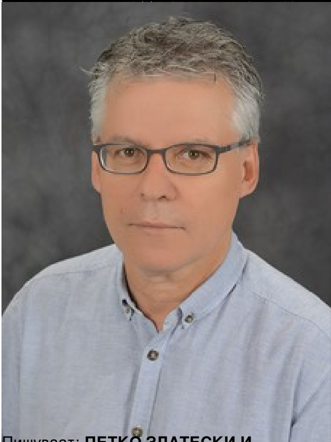
Пишуваат: ПЕТКО ЗЛАТЕСКИ И