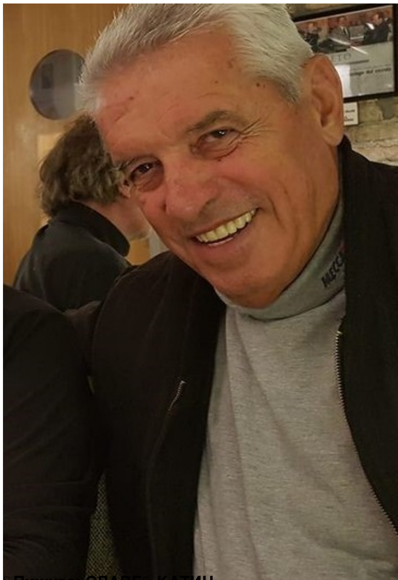
□ Пишува: СЛАВЕ □ КАТИН