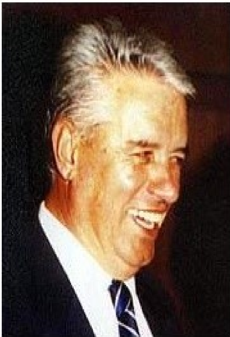
□ Пишува: СЛАВЕ □ КАТИН