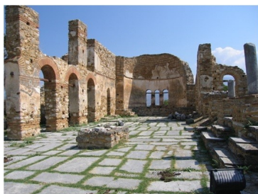
Црквата Свети Ахил на истоимениот остров во Малото Преспанско Езеро

Првите две групи регрути веднаш биле масакрирани по вовлекувањето во борба со прекалената грчка војска. Сите тие биле помали од петнаесет години, немале борбено искуство и немале никаква претстава што да очекуваат. Третата група заминала од Романија и отишла во Рудари, Преспа, преку Бугарија и Југославија. По пристигнувањето, младите војници биле испратени во Штрково, друго село во Преспа, на едномесечна воена обука и подготовка за борба.